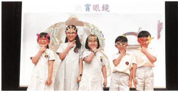
戴上獨有的欣賞眼鏡，讓學生學懂欣賞別人。