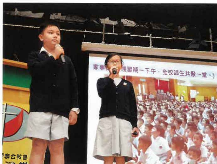
學校設有學生導遊服務生，不論早會、開放日，也是由學生主導帶領。

學生會的成立，除希望培養學生的領導及溝通能力外，同時也想讓學生之間，更能彼此分享最真實的想法，這亦是成立學生會最重要的原因，校方希望學生會成為有助學校了解學生需要的重要橋樑。林校長坦言過往學校有不少措施也是因為學生會而實行，其中有學生主張一星期有一天無功課日，但後來因為有同學擔心所謂無功課日，只是把功課累積到隔日之後，最終校方安排一星期中有三日的功課堂，取而代之去減輕學生的功課壓力。而近來其中一個建議，令林校長比較印象深刻的，那便是由於全校學生約有1,000人，在禮堂舉行活動時，如需要每人一張椅子空間便一定不夠，因此學生只能坐在地上，亦因為有學生留意到女同學的不便，反映給學校知道，最終改為可以穿運動服回校。林校長表示，這些小建議對學校來說都是相當寶貴，希望能藉以為學生提供更好的學習環境。