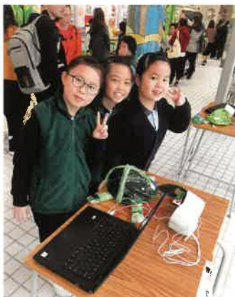
學校積極推動STEM發展。

同時，學校近來積極發展正向教育，協助學生建立正向的意義人生。如：建立JOYFUL Account，並結合Learning Passport，從中記錄學生在校的成功經驗、感恩經歷或好人好事，並與人分享，一方面學習「儲蓄」正面情緒，另一方面亦學習以正面情緒感染別人。而「欣賞眼鏡」活動，亦是學校生命教育的一大特色，為學校設立欣賞平台，並讓學生佩戴自家製的「欣賞眼鏡」，表揚校內的好人好事，提升欣賞文化，培養學生懂得欣賞別人的情操，以及學習正向生活態度，提升他們的正面情緒。