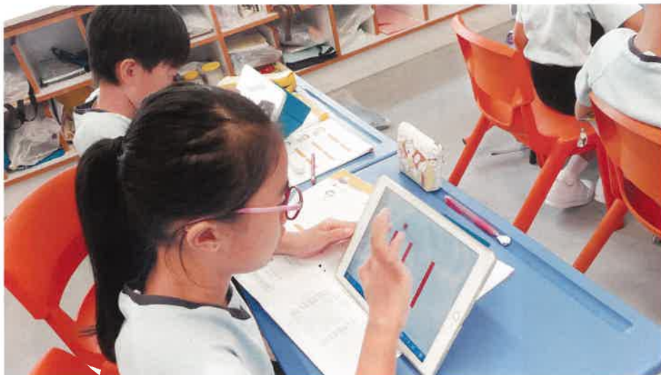
學校利用電子學習作自主學習工具。