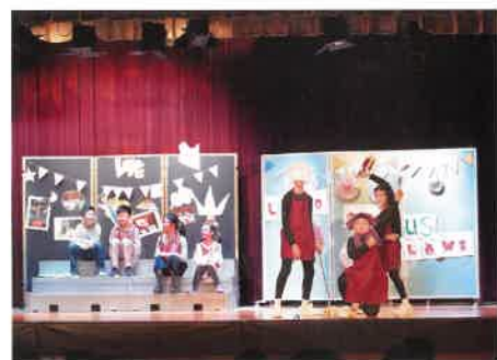
學好英語需要給予學生展示的機會。圖為學校舉辦的英語話劇活動。

入手，由老師收集學生學習表現，到網上教學的點撥、澄清、深化教學。同時，學校積極進行教師培訓，鼓勵老師互相分享教學心得，交流以擴闊視野，提升自身專業水平，提高教學成效，推動各科的優質教育，促進和協助孩子尋找有效的學習方法，達至優化課堂教學。同時校方期望能在疫情下各取實體教學及網課的優勢，逐步實踐混合式學習（Blended Learning），以助迎接教學新常態。