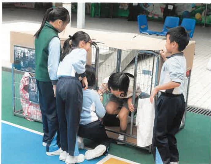
為擴闊學生的學習經驗，小三學生會參加貧窮家庭生活體驗。