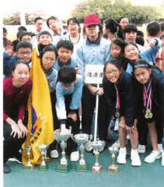
學生在田徑比賽中，獲得多項獎項。