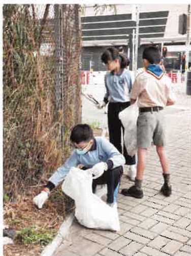
五年級學生參與義工體驗，為社區清潔。