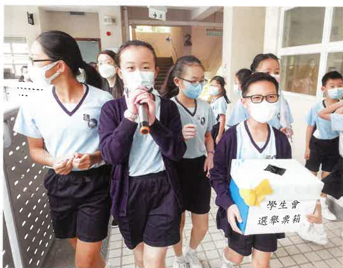
學生會選舉是學校的一大特色。