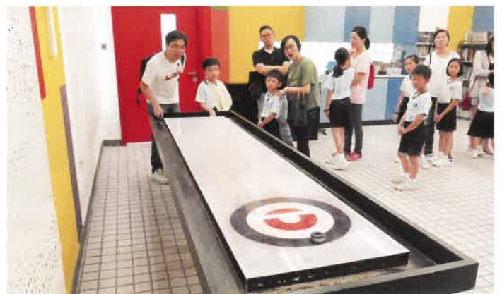
學校十分重視家校合作，特設晨間親子活動，拉近家長、學生及學校的關係。