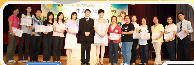
第 4 屆