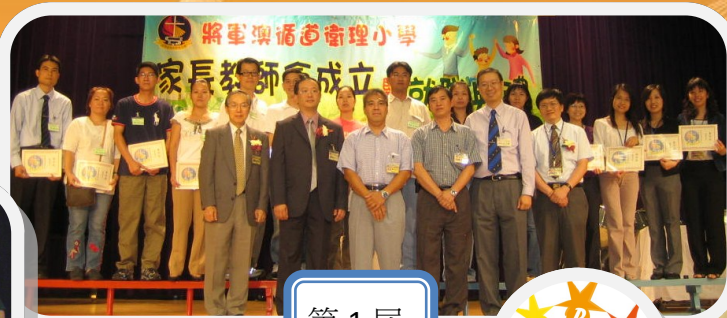
第 1 屆