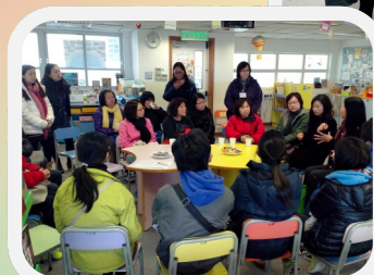
景嶺書院家教會委員到校

召集 「小六敬師茶會籌備小組」 會議即將召開，有興趣參與 之六年級家長可與家教會委員 聯繫。