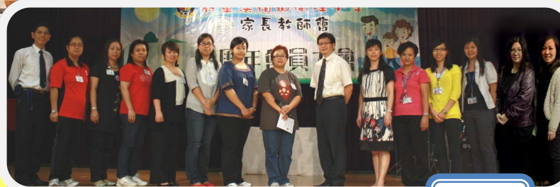
第 5 屆