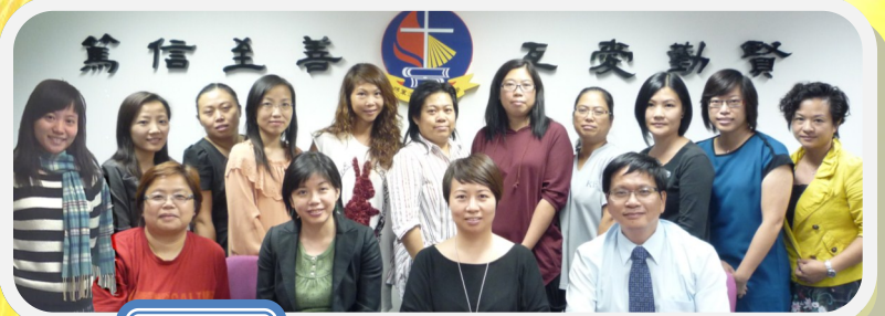
第 6 屆