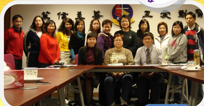
第 3 屆