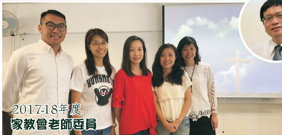
2017-18年度 家教會老師委員