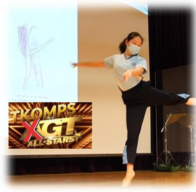
5月下旬舉行的高小英文拔尖班活動--TKOMPS Got Talents