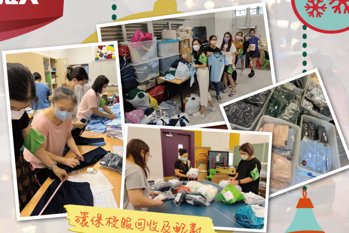
環保校服回收及配對