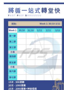
將循一站式轉堂快