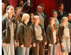
挪威合唱團到本校表演