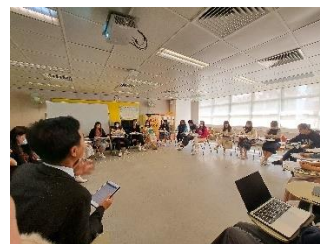
QSIP 專科支援人員與全體 中文科任觀課後交流

從科組問卷中，90%老師透過分科觀課，認識到課堂回饋可從不問向度(feed up-認清學習目標, feed back 了解學習表現, feed forward-延展課堂所學)作課堂回饋。同時，97%老師都同意透過核心圈/學習圈交流，他們都能為該課堂訂立適切基礎線和進階目標，並選取適切的策略，構思課堂回饋的策略來照顧學習多樣性。另外，有些老師欣賞核心圈及學習圈觀課文化能提升教師專業，提供平台加強老師交流，互相學習。