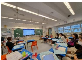
英文科核心圈備課

QSIP 專科支援人員帶領中英數科科主任，選取一級作核心圈，在上學期選取一個學習單元進行教學設計：訂立基礎線，運用照顧學習多樣性的教學、評估及回饋策略，繼而透過分科課堂觀摩交流。藉培訓種籽先驅，推展照顧學習多樣性課程。下學期，其他年級以學習圈形式，選取一教節作嘗試，透過彼此備課、課堂觀摩及交流教學心得。