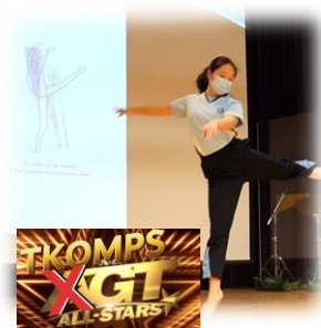
5月下旬舉行的高小英文拔尖班活動--TKOMPS Got Talents