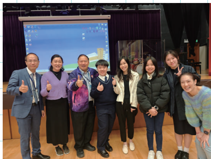
西聯傑出家長及老師嘉許禮