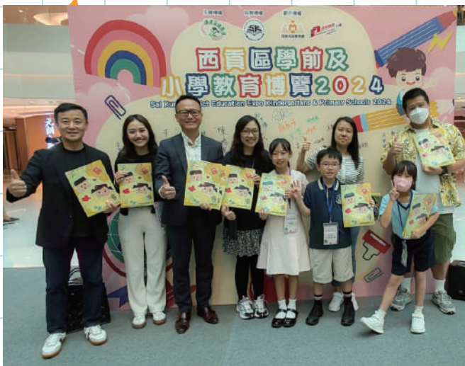
西貢區小學教育博覽