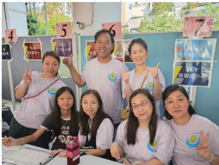
西聯中學巡禮義工