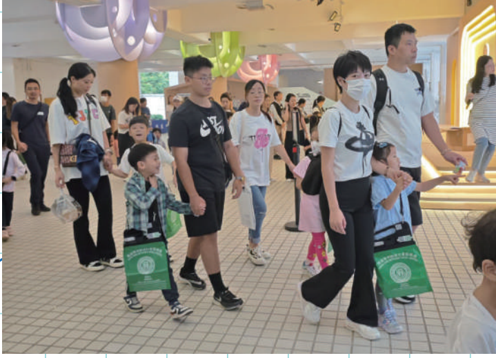
責旗籌款家長義工