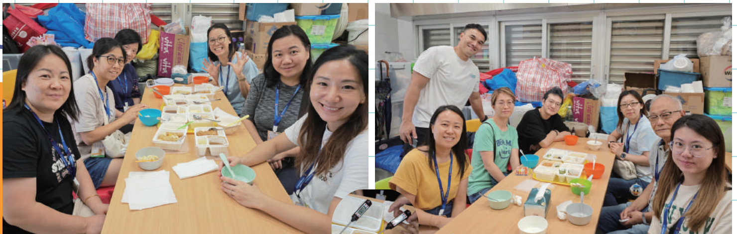
午膳關注小組-突擊試飯