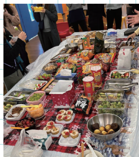
家長義工聖誕聯歡會