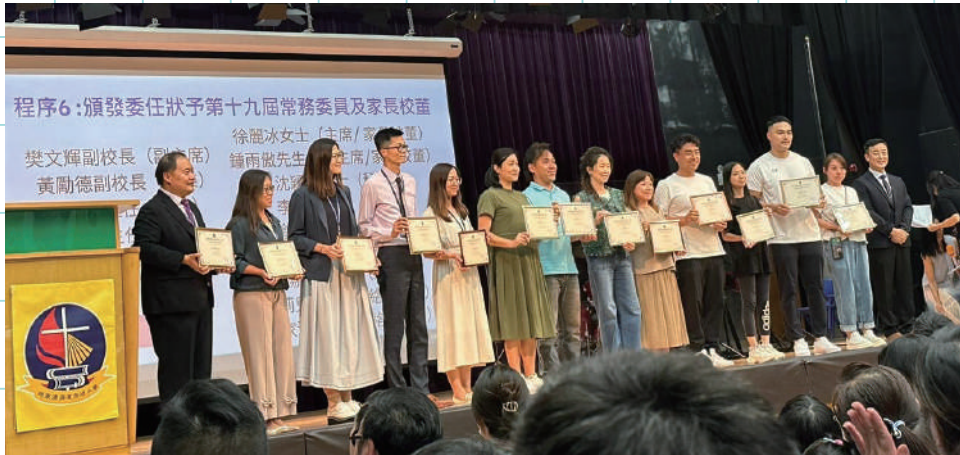
週年大會及新一屆PTA委任儀式(8月)