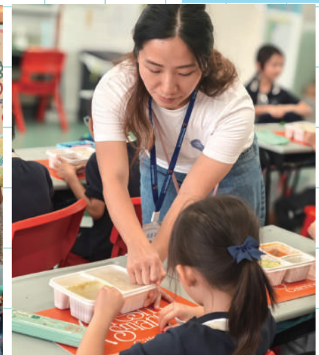
小一午膳家長義工